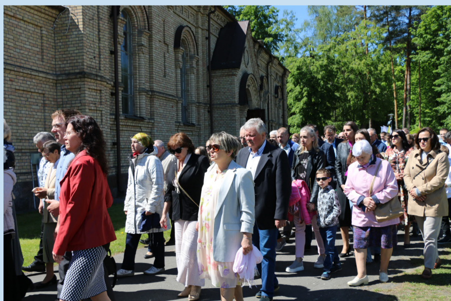
Wierni odśpiewali znaną pieśń religijną: „O Maryjo, witam Cię!”