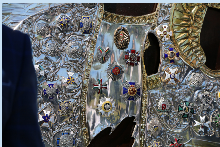
Na płaszczu hetmańskim Matki Bożej pojawiły się repliki odznak państwowych.