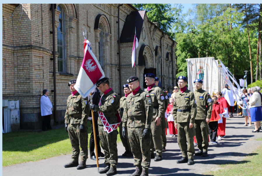
Ceremonię uświetnili przedstawiciele Wojska Polskiego.