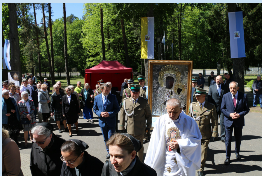
Obraz jest niezwykle ważny z powodów religijnych, patriotycznych i historycznych.