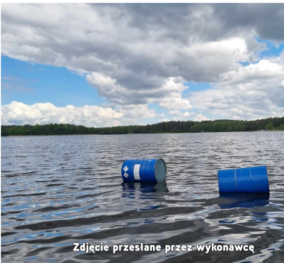
Zdjęcie przesłane przez wykonawcę