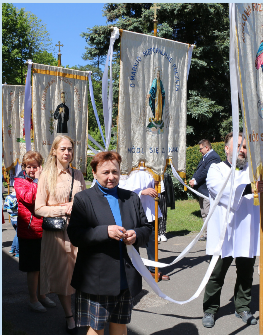
Przed mszą świętą wokół kościoła przeszła procesja.