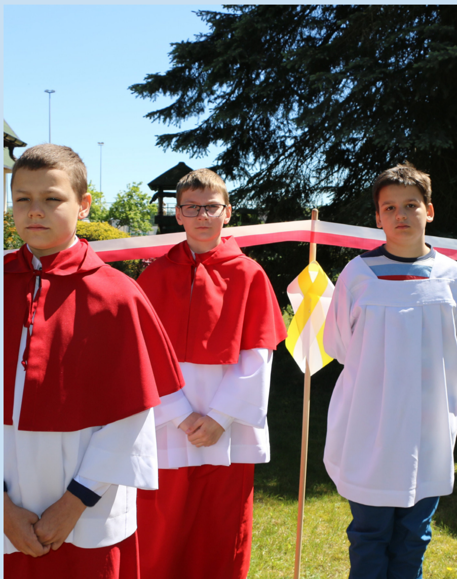
W uroczystości wzięła udział cała społeczność parafii.