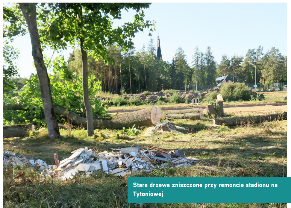
Stare drzewa zniszczone przy remoncie stadionu na Tytoniowej