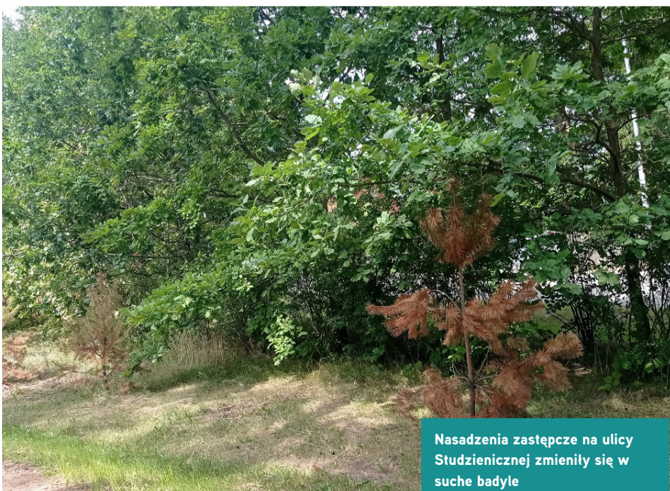
Nasadzenia zastępcze na ulicy Studziennej zmieniły się w suche badyle