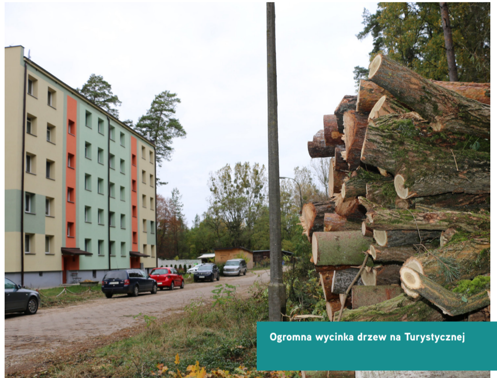
Ogromna wycinka drzew na Turystycznej