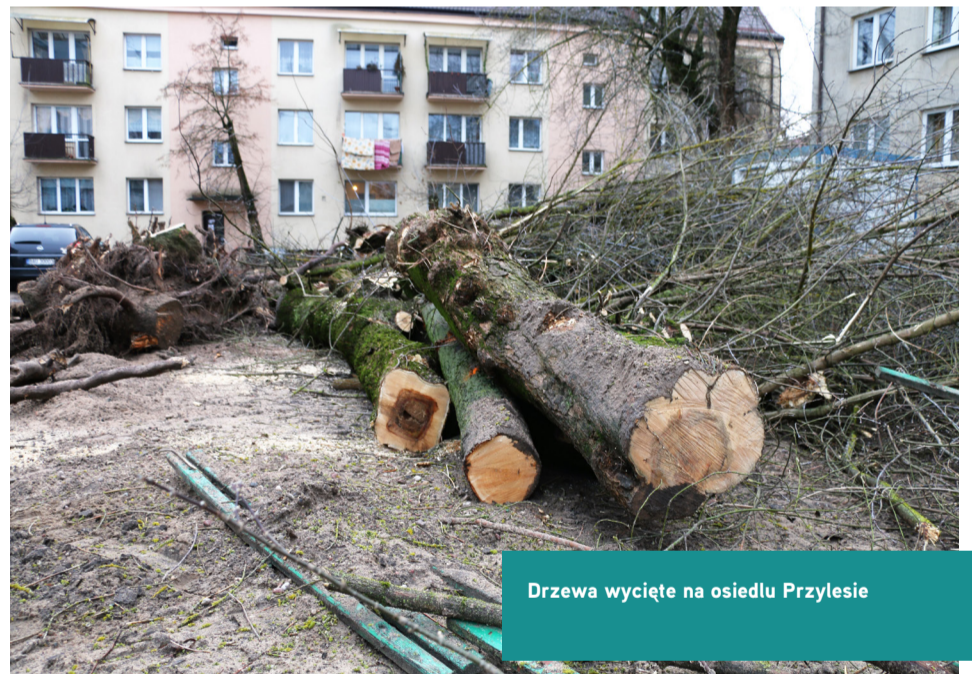
Drzewa wycięte na osiedlu Przylesie