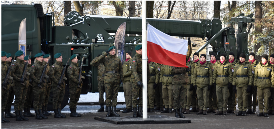
Uroczyste podniesienie flagi państwowej w 1 Batalionie Saperów w Augustowie

4 GRUDNIA MARIUSZ BŁASZCZAK – MINISTER OBRONY NARODOWEJ SPOTKAŁ SIĘ Z ŻOŁNIERZAMI UTWORZONEGO W AUGUSTOWIE 1 BATALIONU SAPERÓW.