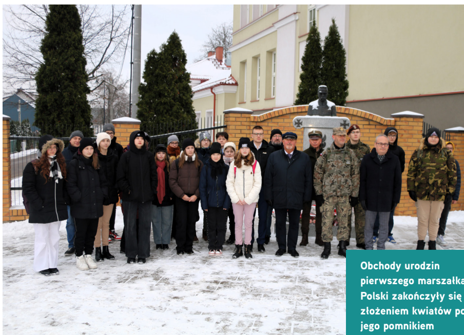
Obchody urodzin pierwszego marszałka Polski zakończyły się złożeniem kwiatów pod jego pomnikiem