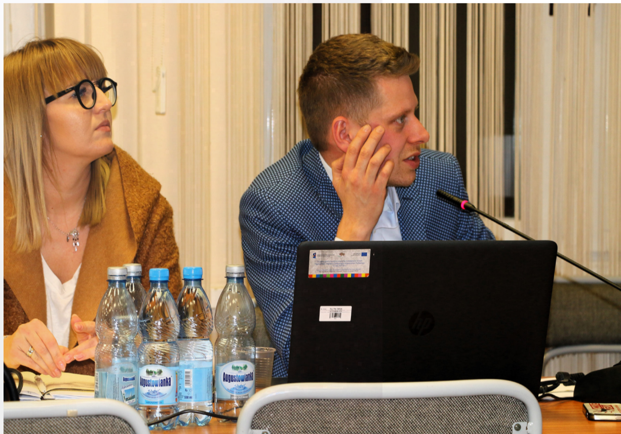
Wykonawca nie wywiązał się z umowy, brutalnie łamiąc jej zapisy i mając za nic zobowiązania -twierdzą urzędnicy

-Jest to koszmarny przykład jak nie należy prowadzić inwestycji. Zastępcy