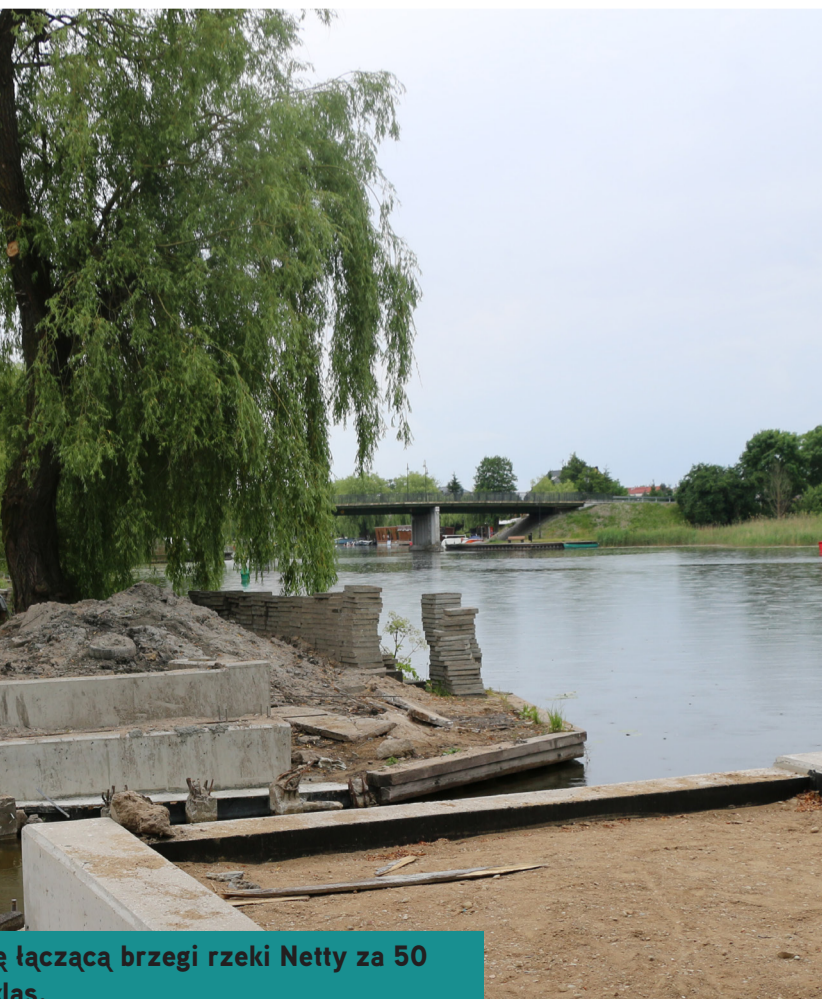
kładkę łączącą brzegi rzeki Netty za 50 mln zł.