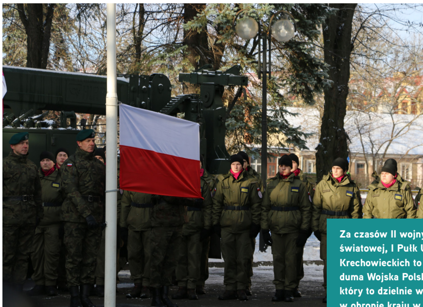
Za czasów II wojny światowej, I Pułk Ułanów Krechowieckich to była duma Wojska Polskiego, który to dzielnie walczył w obronie kraju w 1939 r.