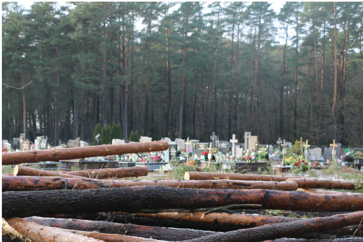
Od kilku lat funkcjonuje w budżecie ta sama kwota kilkudziesięciu tysięcy złotych na cmentarz komunalny, ale nie widzimy żadnych efektów.

Mieszkańcy odwiedzający cmentarz parafialny w Augustowie dostrzegają, że intensywnie zapełnia się nowymi grobami. Pod koniec grudnia w sąsiedztwie szpitalnego prosektorium doszło do bardzo dużej wycinki dorodnych drzew. Od lat władze miasta „pochylają się” nad budową cmentarza komunalnego, który odciążałby parafię. Rezultatów jednak nie widać.