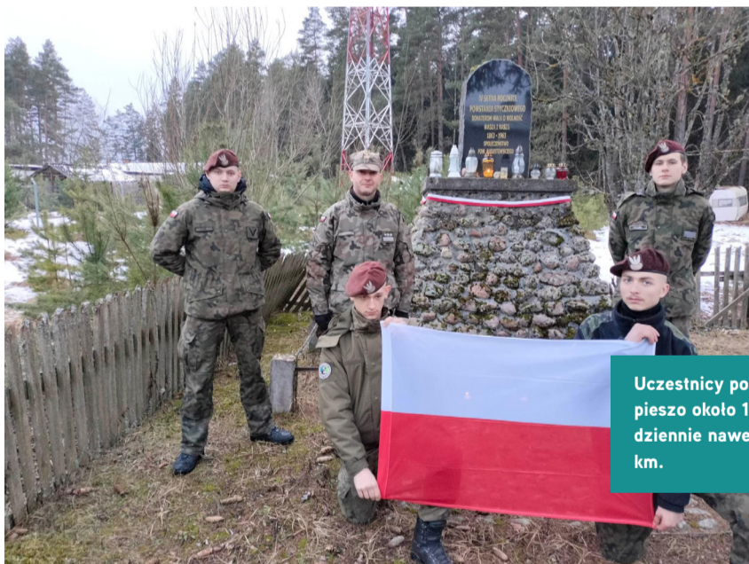
Uczestnicy pokonają pieszo około 117 km, dziennie nawet po 20 km.

Fot. Zdjęcie wykonane podczas ubiegłorocznego marszu.