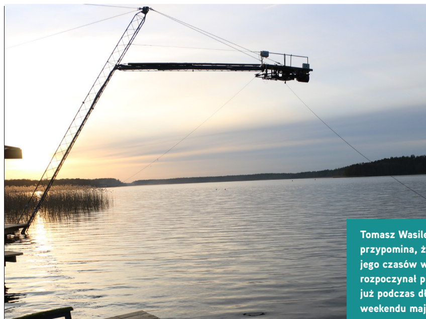
Tomasz Wasilewski przypomina, że za jego czasów wyciąg rozpoczynał pracę już podczas długiego weekendu majowego.