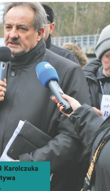
ł Karolczuka tywa