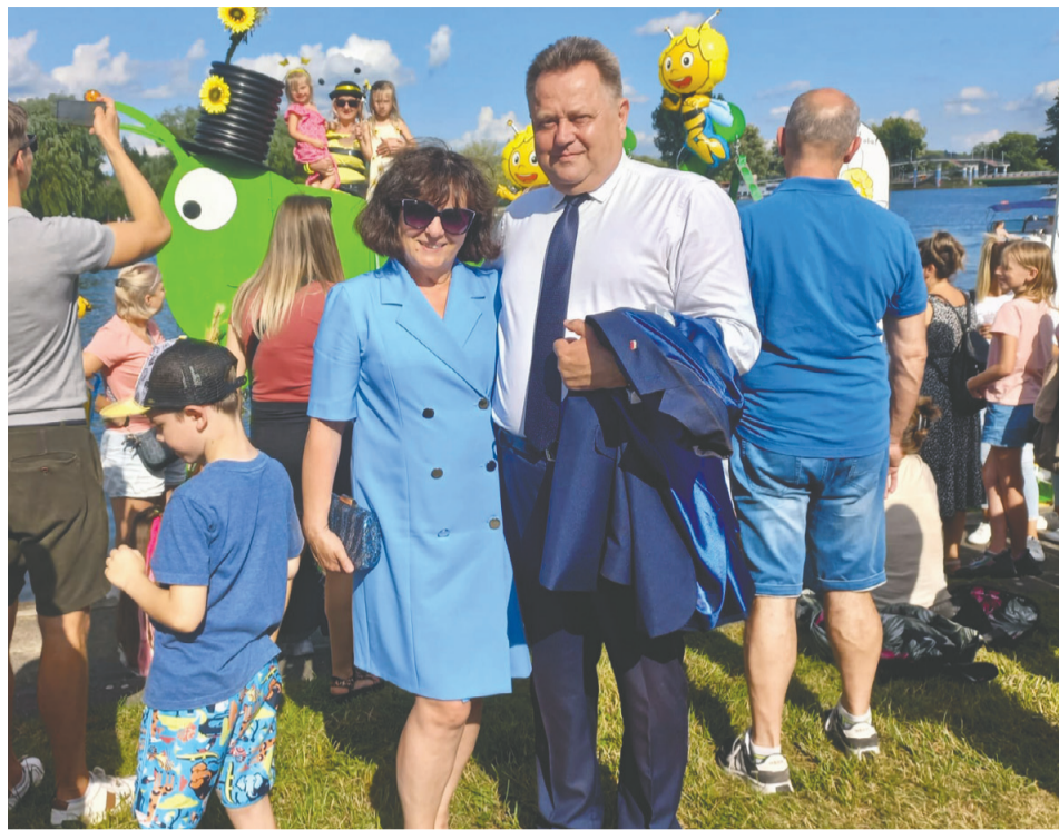
26. edycja Mistrzostw Polski w Pływaniu na Byle Czym w Augustowie, 30 lipca 2023 roku