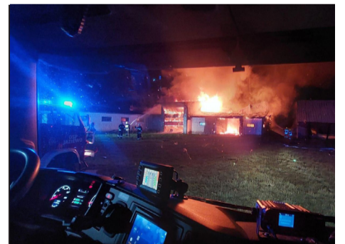
24 czerwca strażacy z Augustowa i pobliskich gmin uczestniczyli w gaszeniu dwóch pożarów -w Starym Rogoźynie oraz Mogilnicach.

24 czerwca, po godzinie 21 00 do strażaków wpłynęło zgłoszenie o pożarze budynku mieszkalnego w Starym Rogoźynie, gm. Lipsk. Strażacy stwierdzili pożar kuchni w drewnianym budynku oraz oznaki pożaru na nieużytkowanym poddaszu. Z kuchni wyniesiono i schłodzono dwie butle z gazem propan-butan. Właściciel budynku nie odniósł obrażeń, ewakuował się przed przyjazdem straży. Budynek nie nadaje się do zamieszkania, właściciel znalazł schronienie u rodziny. Po północy zgłoszono kolejny pożar, tym razem budynku gospodarczego