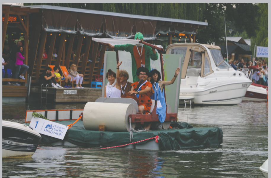
Nie zabrakło pomysłów inspirowanych znanymi bajkami.