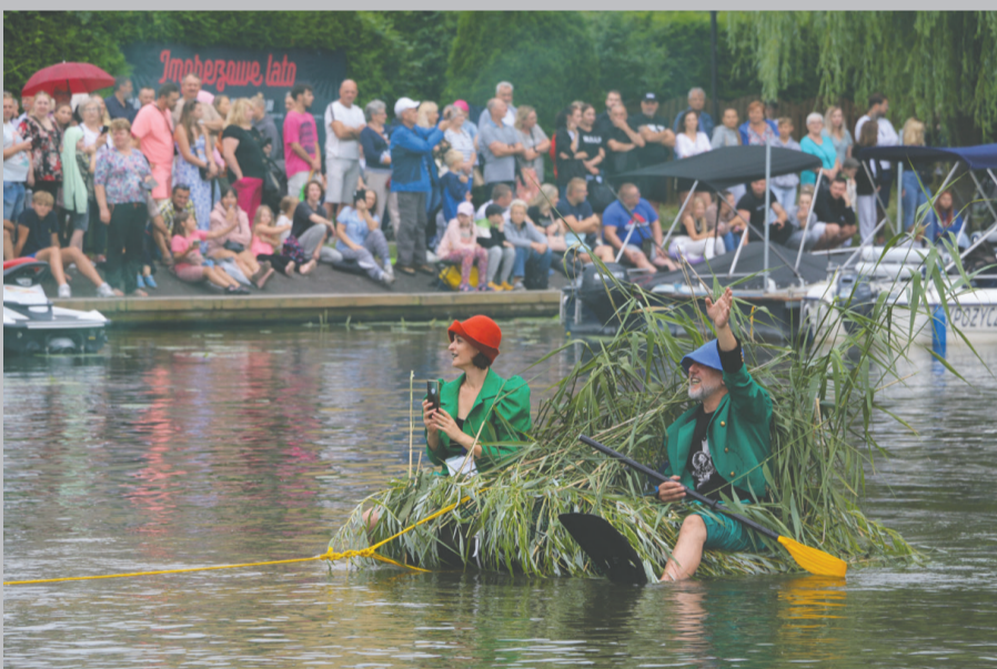
Wiele pływadeł było wykonanych z ekologicznych materiałów, tj. trawy, drewna, a nawet kartonu.