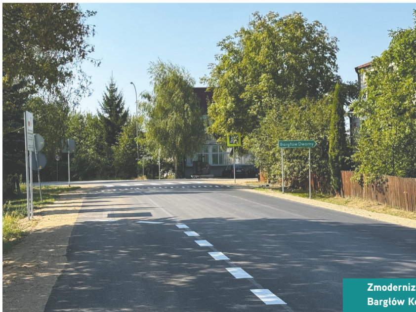
Zmodernizowany odcinek drogi w ramach ciągu Bargłów Kościelny – Granica Państwa