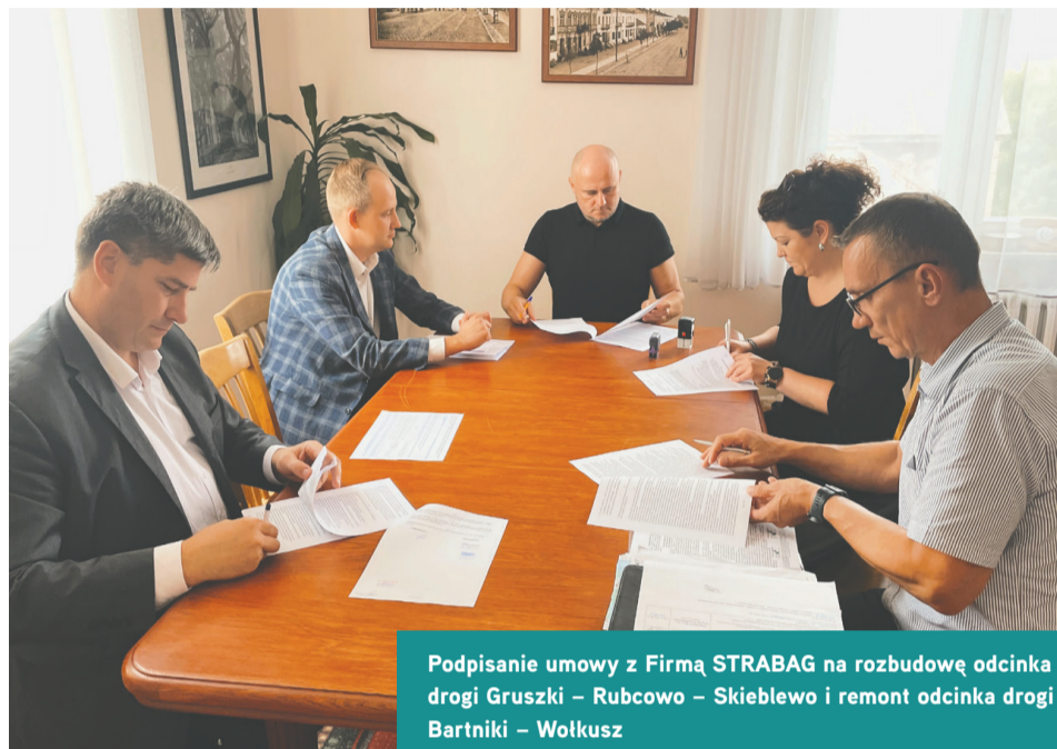
Podpisanie umowy z Firmą STRABAG na rozbudowę odcinka drogi Gruszki – Rubcowo – Skieblewo i remont odcinka drogi Bartniki – Wołkusz