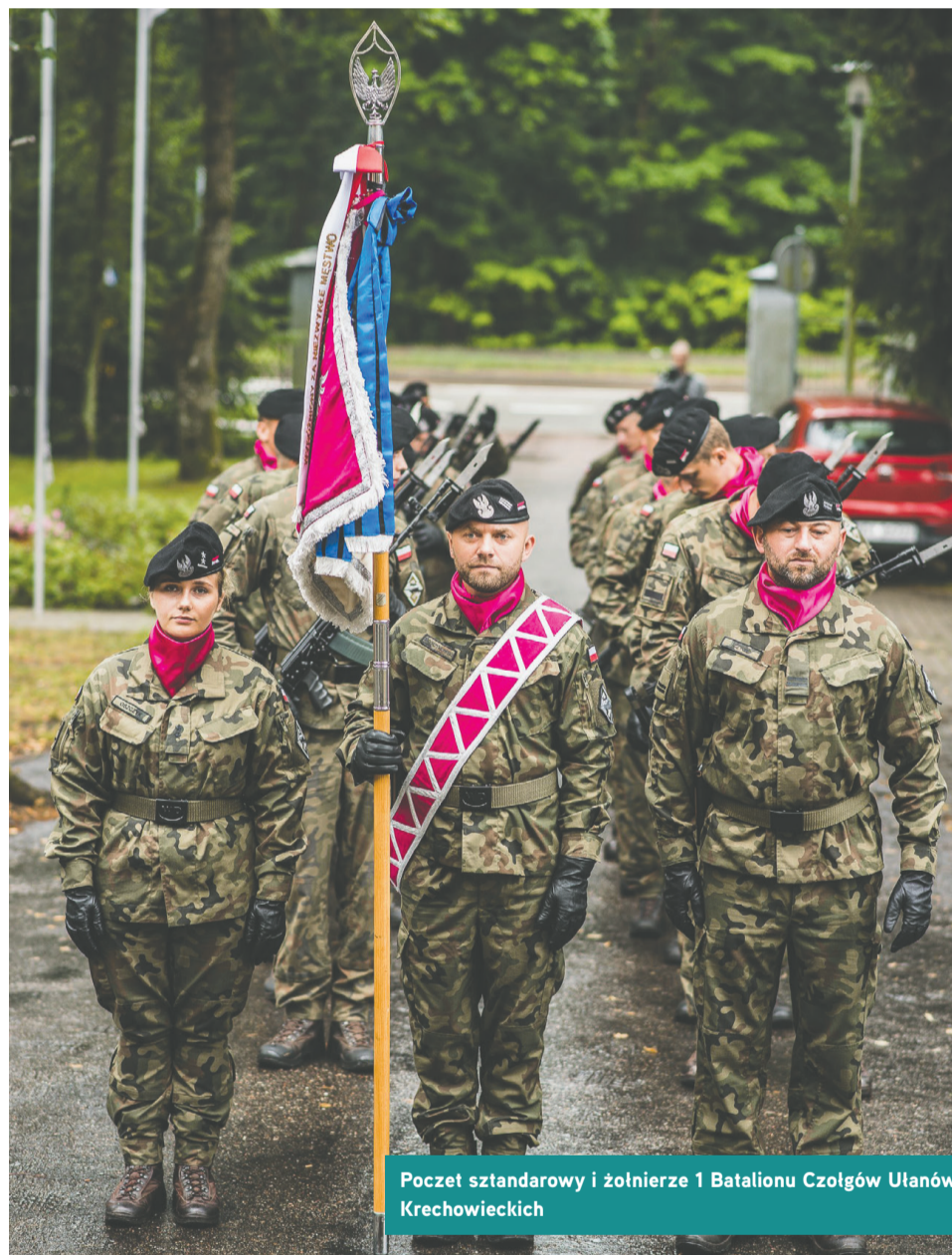
Poczet sztandarowy i żołnierze 1 Batalionu Czołgów Ułanów Krechowieckich