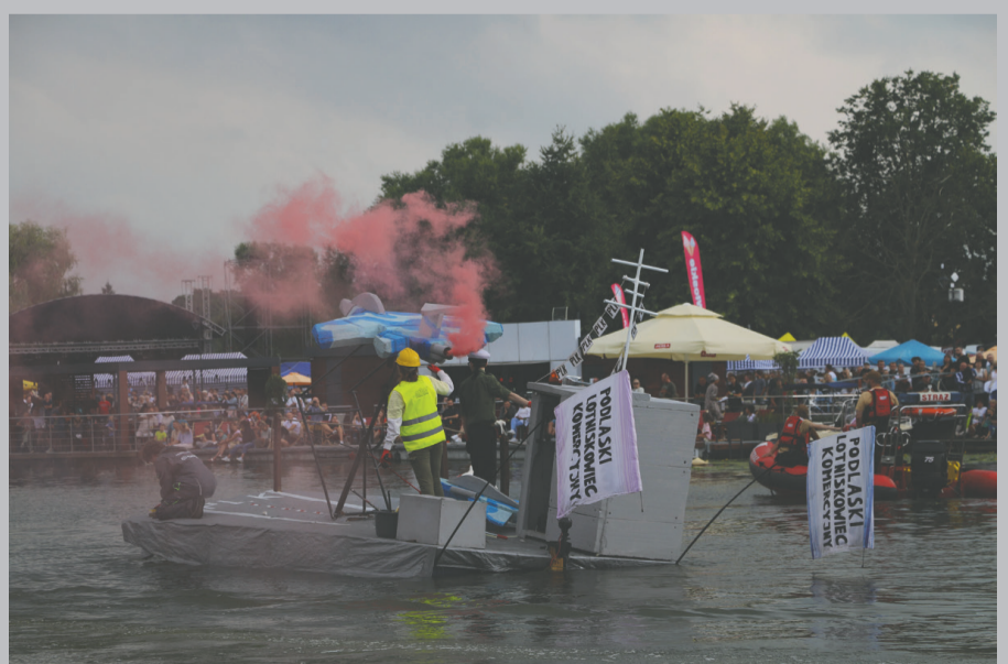
„Podlaski Lotniskowiec Komercyjny”.