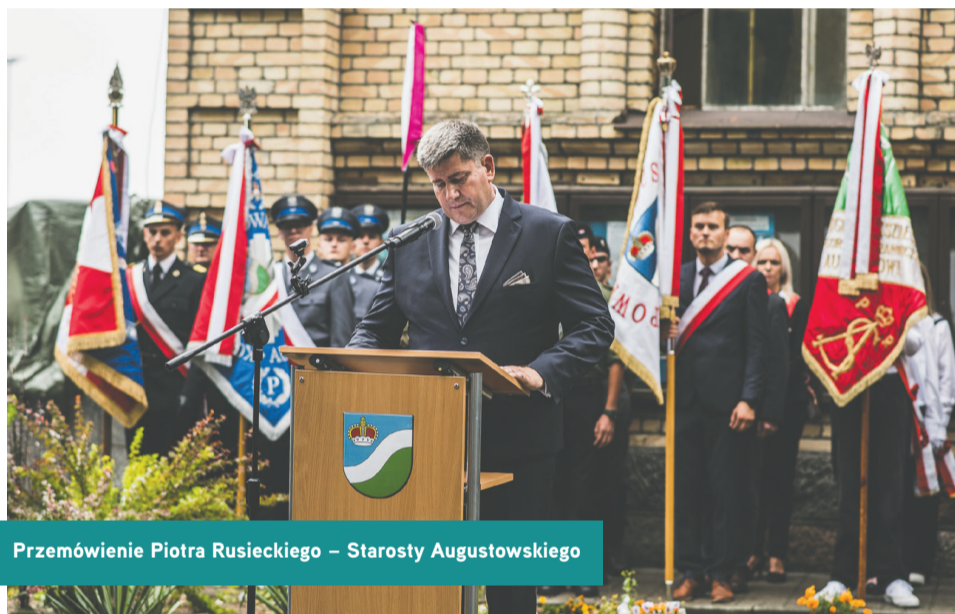
Przemówienie Piotra Rusieckiego – Starosty Augustowskiego