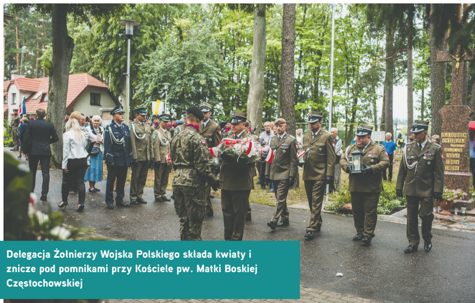
Delegacja Żołnierzy Wojska Polskiego składa kwiaty i znicze pod pomnikami przy Kościele pw. Matki Boskiej Częstochowskiej