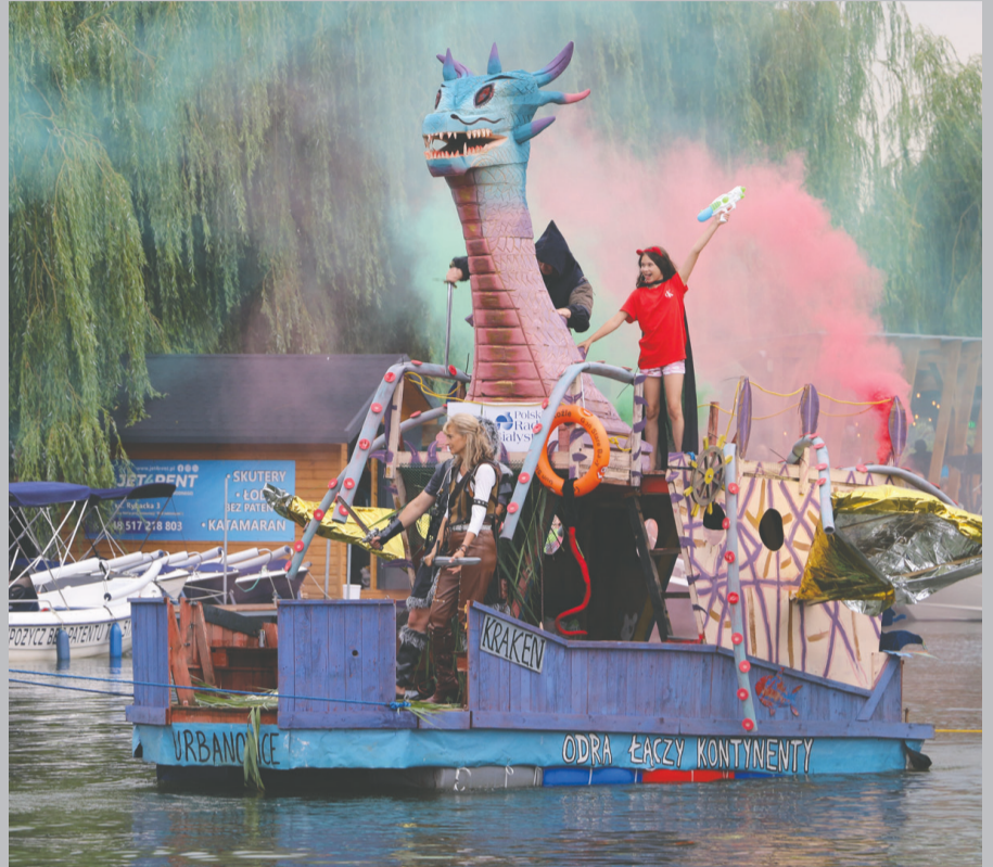
Zawodnicy zaskoczyli wyobraźnią i wypłynęli na Nettę na swoich projektach inspirowanych bajkami bądź wytworzonych w ich własnej głowie.