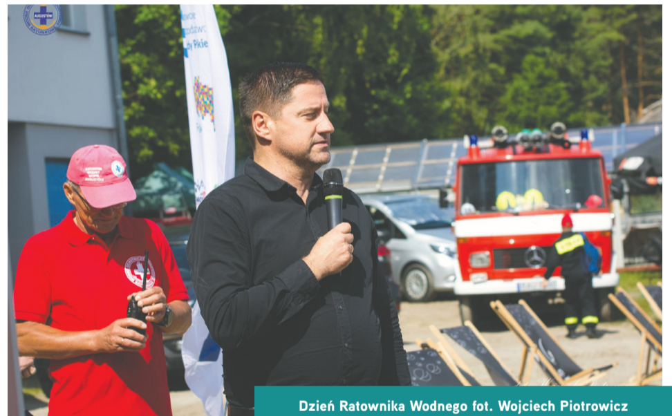
Dzień Ratownika Wodnego