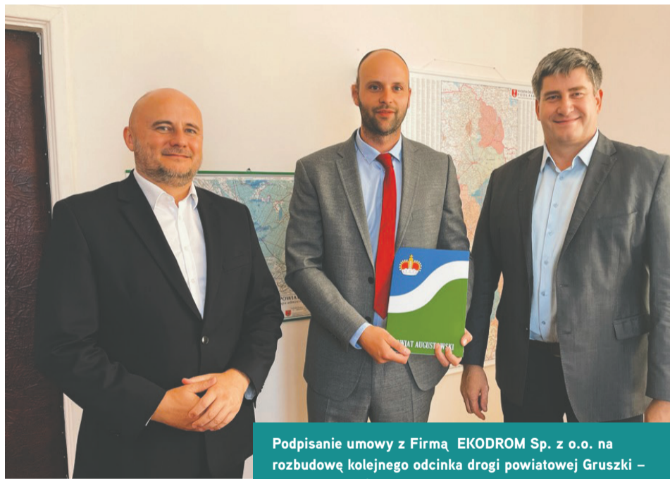
Podpisanie umowy z Firmą EKODROM Sp. z o.o. na rozbudowę kolejnego odcinka drogi powiatowej Gruszki – Rubcowo – Skieblewo