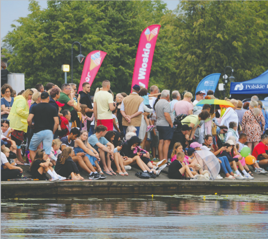
Na augustowskich bulwarach zgromadziły się tłumy ludzi, którzy chcieli zobaczyć imponujące i kreatywne pływadła.

28 lipca na rzece Nettcie odbyły się, jak co roku, Mistrzostwa Polski w Pływaniu Na Byle Czym „Co Ma Pływać Nie Utonie”.