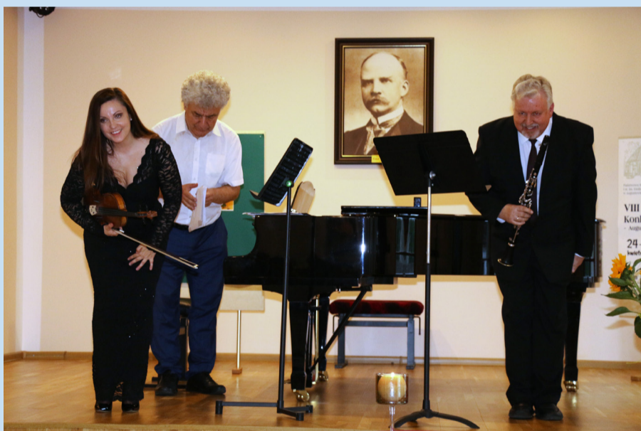
Artyści kłaniający się publiczności.