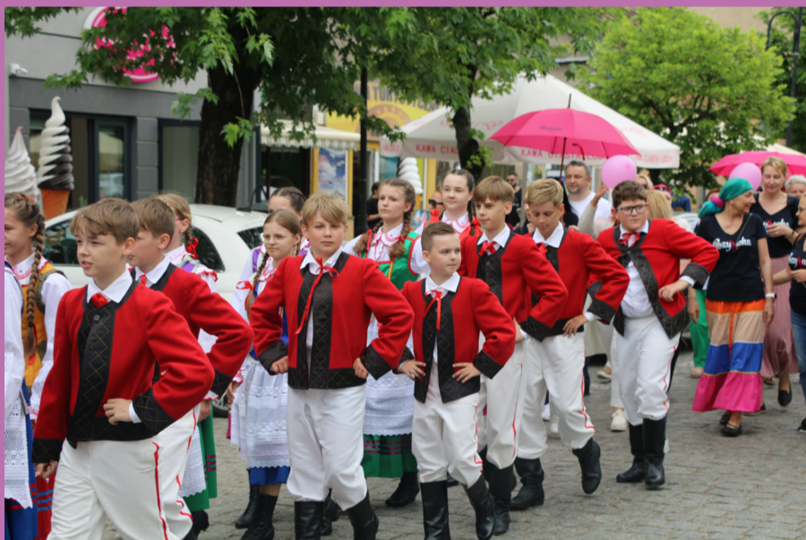
Młodzi artyści z "Bystrego" podczas marszu wokół Rynku Zygmunta Augusta.