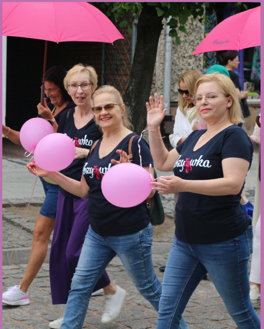
Atmosfera wydarzenia była bardzo radosna.