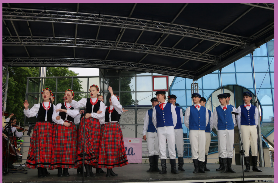
Występ Zespołu "Bystry".