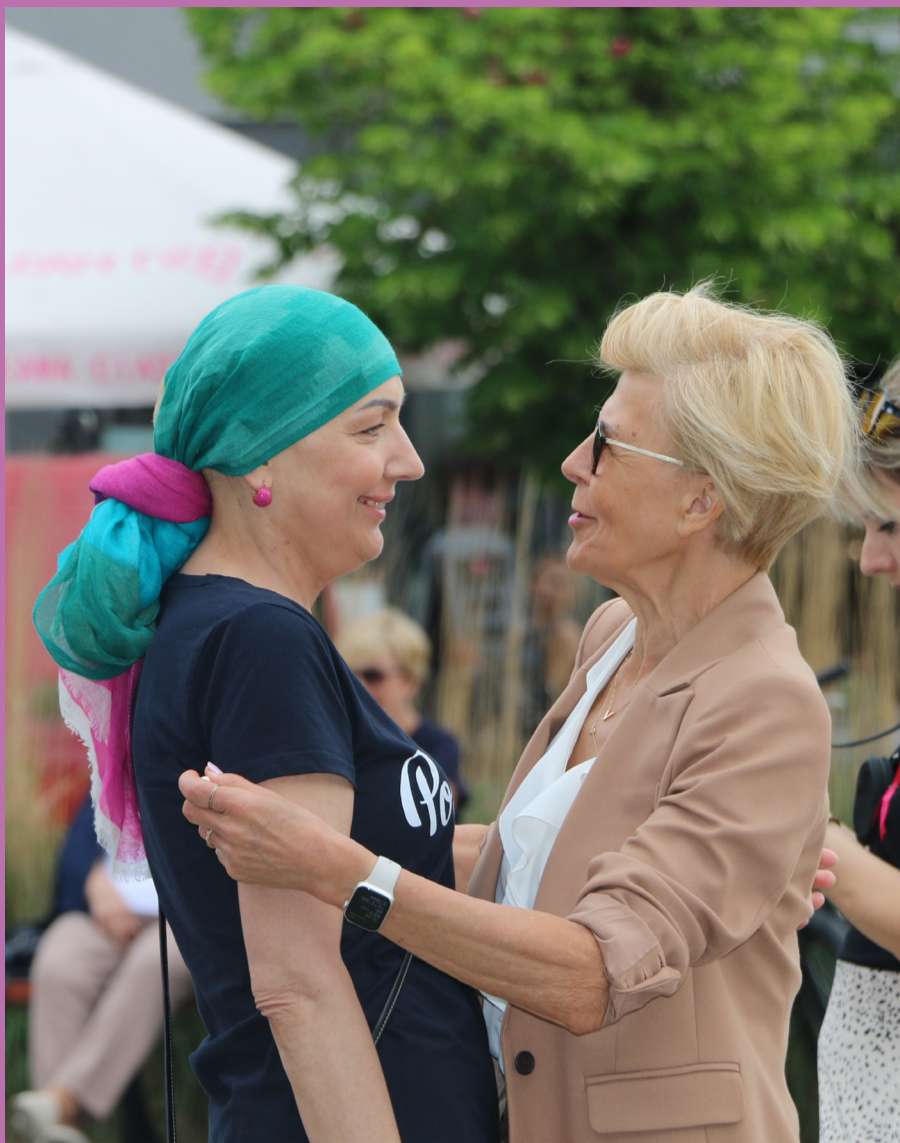
Atmosfera marszu była bardzo pozytywna i pełna wzajemnego wsparcia.