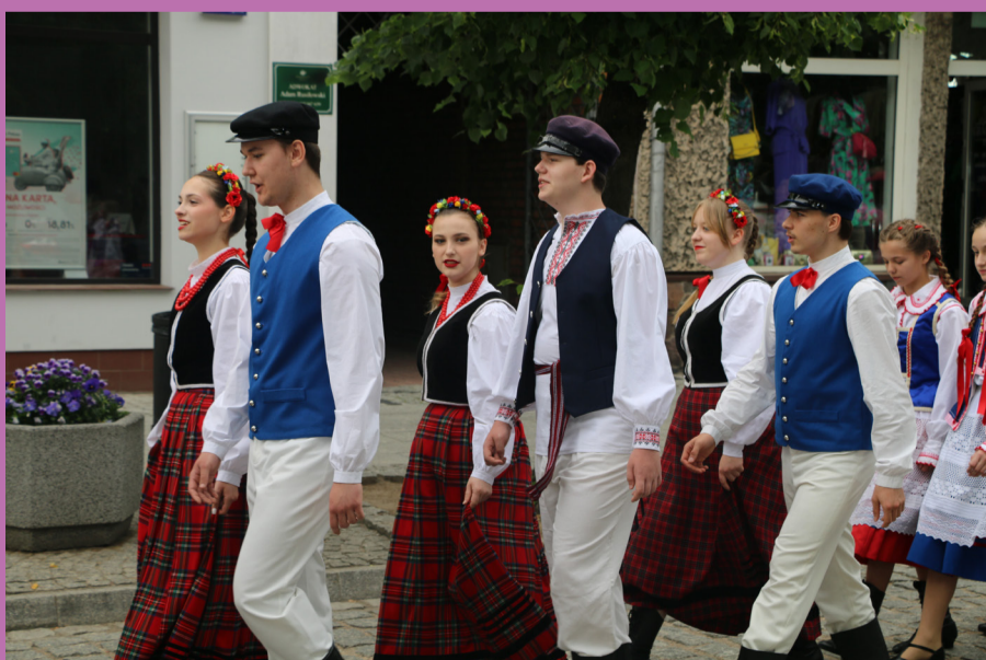
Zespół "Bystry" podczas marszu.