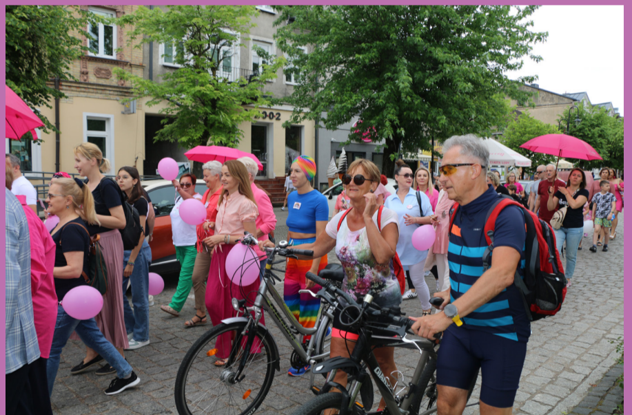
Nie zabrakło także mieszkańców miasta, wspierających ideę Pozytywnego Marszu Kobiet.