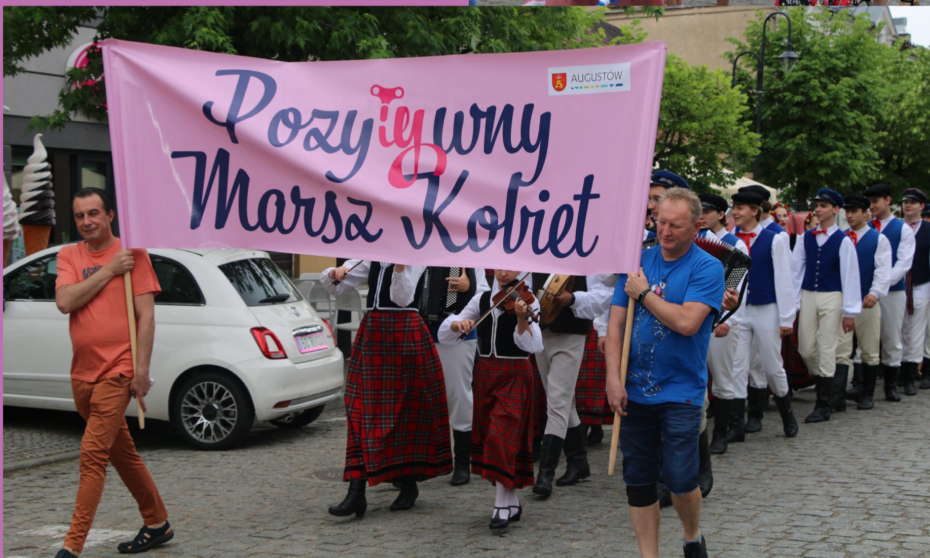
Pozytywny Marsz Kobiet odbywał się już po raz kolejny.