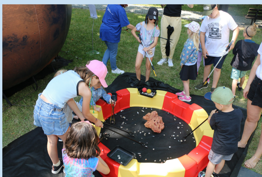
Najmłodszych uczestników festiwalu bardzo interesowały gry i zabawy związane z kosmosem.