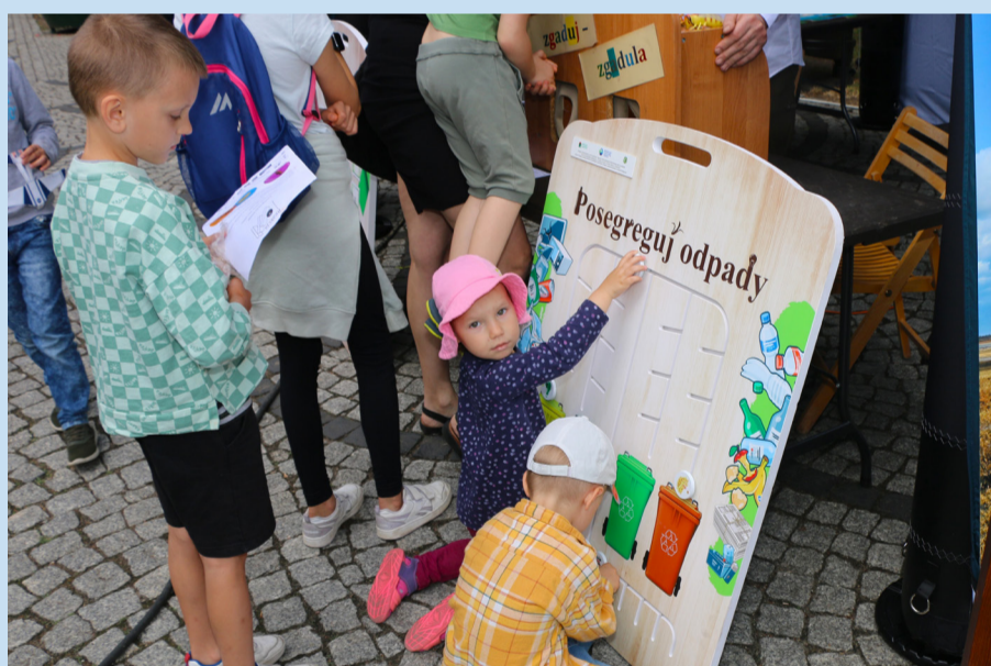
Festiwal zapewnił najmłodszym małą lekcję ekologii, która polegała na nauce segregacji śmieci.