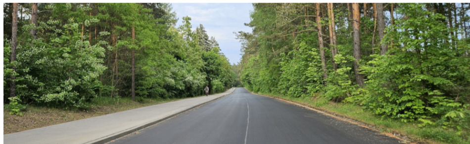
Zmodernizowana ulica Turystyczna w Augustowie

Dobiegł końca remont ul. Turystycznej w Augustowie. Zadaniem objęty był odcinek o długości ok. 1,3 km. Był to ostatni etap prac, dzięki któremu Powiat zakończył modernizację nawierzchni jezdni całej ul. Turystycznej.