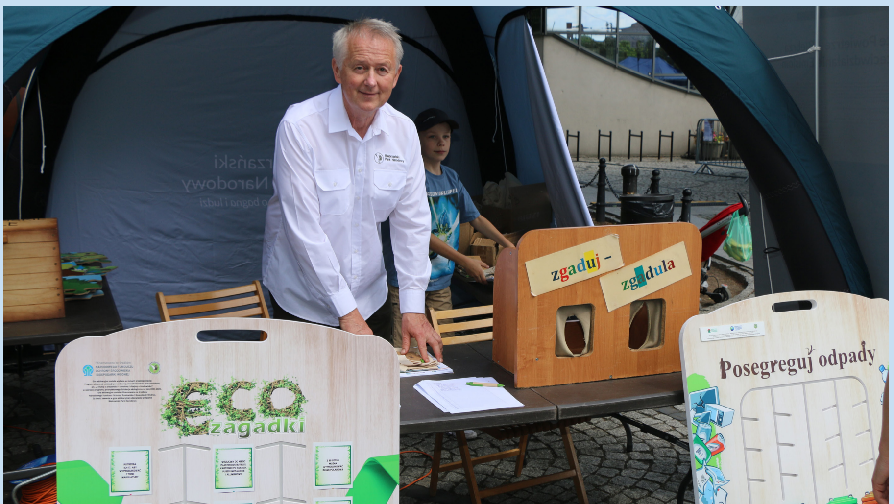
Jedno ze stanowisk na festiwalu.