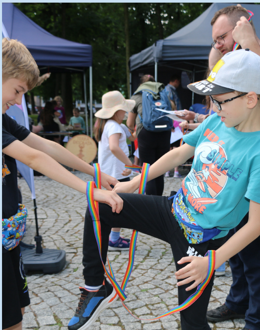
Dzieci ćwiczyły pracę zespołową poprzez zadanie wydostania się z zaplątanych lin.