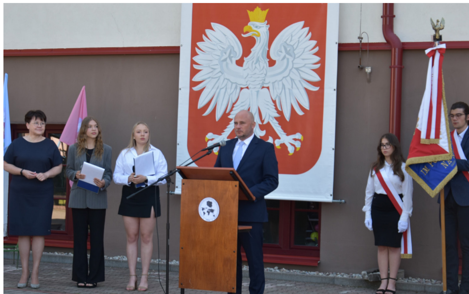
Zakończenie roku szkolnego w II Liceum Ogólnokształcącym

W miniony piątek prawie 2200 uczniów ze szkół powiatowych rozpoczęło wakacje.