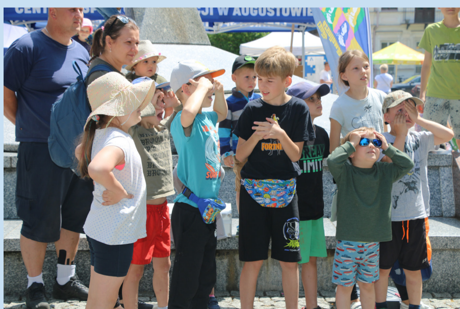
Dzieci bawiące się w grupie.