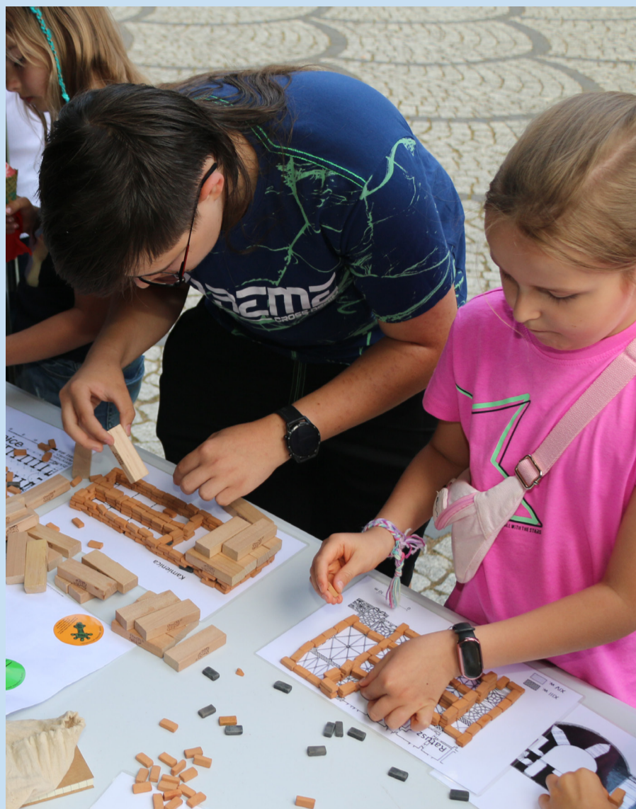
Układanie figur z klocków.