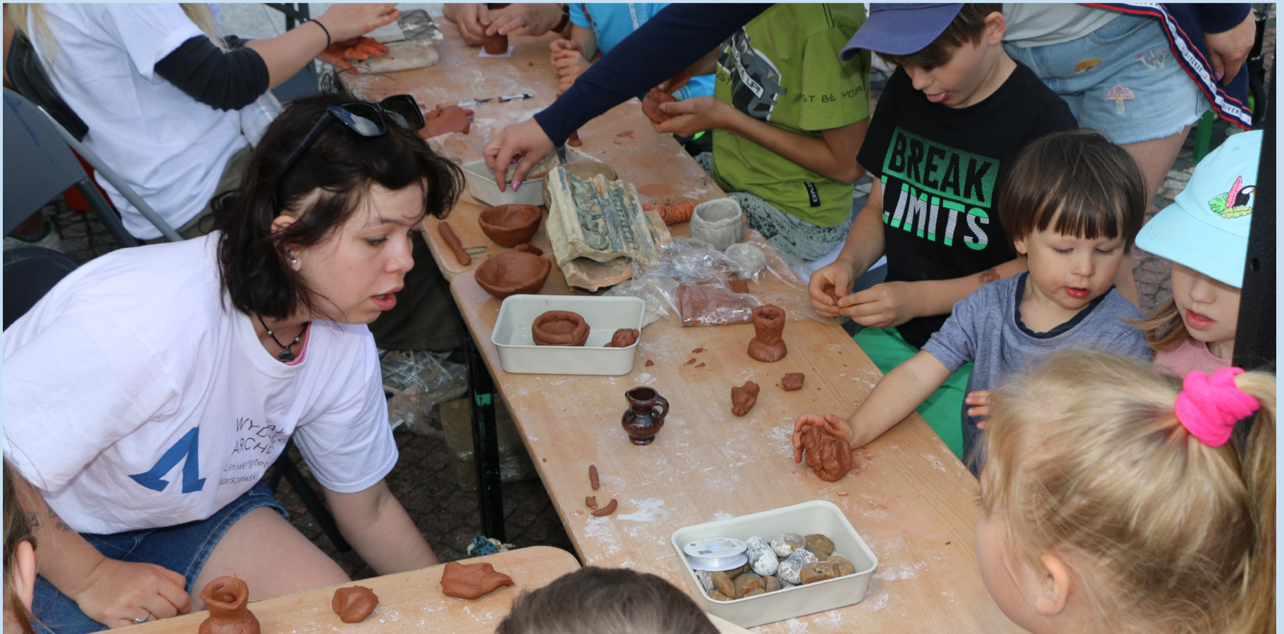
Najmłodsi mogli rozwijać kreatywność poprzez zabawę z gliną.