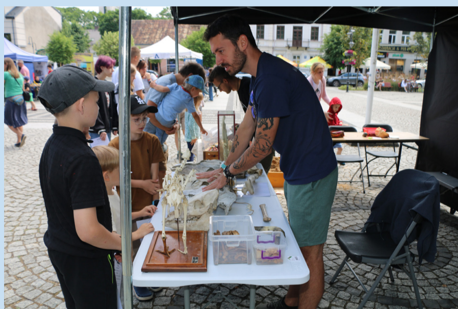
Jedno ze stanowisk na festiwalu.