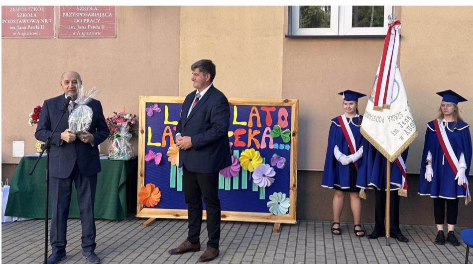
Zakończenie roku szkolnego w Zespole Szkół Specjalnych