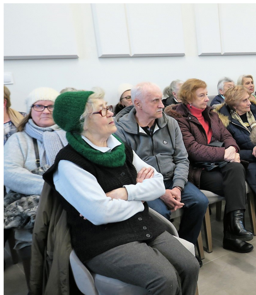
Takich tłumów magistrat dawno nie widział. Mieszkańcy protestują o ciepło.

W ostatnich latach augustowianie zostali dotknięci gigantycznymi podwyżkami opłat za ciepło miejskie i otrzymywali wyższe rachunki niż osoby mieszkające w okolicznych miastach. Było to spowodowane brakiem modernizacji ciepłowni miejskiej. To pokłosie zaniedbań władz miejskich. W marcu 2023 r. do magistratu przybyło mnóstwo zdesperowanych mieszkańców Augustowa i przedsiębiorców opowiadających o swoim