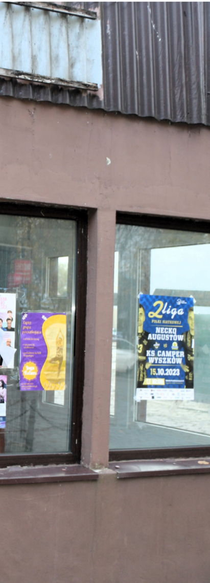
Użytkownicy lokali wokół parku narzekają na ogromne opłaty za czynsz i zestawiają je z ilością wydarzeń w centrum Augustowa. Uważają, iż najważniejsze imprezy są organizowane obok biznesów radnych koalicji rządzącej.