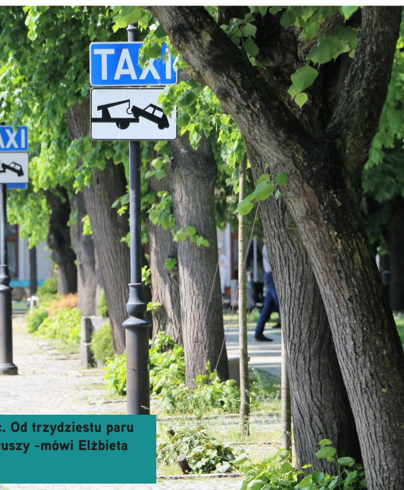
... Od trzydziestu paru mszy - mówi Elżbieta