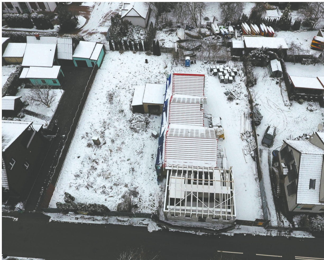
Można nadać samodzielność placówce, która będzie świadczyła usługi dla emerytów. Dobrym przykładem są szkoły działające w budynkach miejskich. Dziś należałoby powołać podmiot emerycki w postaci stowarzyszenia lub placówki, na wzór innych tworzonej przez miasto, takich jak APK.