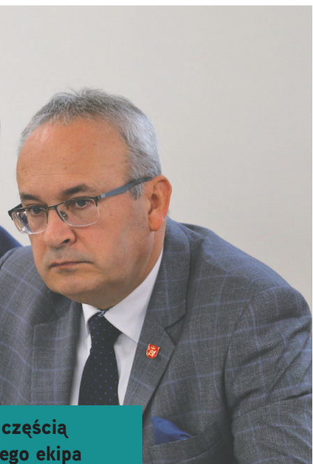
częścią jego ekipa budowlą