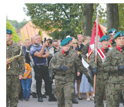
W czasie uroczystości odczytano apel pamięci i została oddana salwa honorowa.