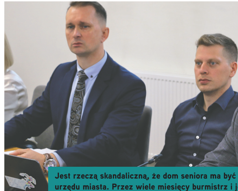
Jest rzeczą skandaliczną, że dom seniora ma być urzędem miasta. Przez wiele miesięcy burmistrz i j zapewniali emerytów i rencistów, że powstająca b będzie azylem dla osób starszych i samotnych.

Grupa mieszkańców zebrała blisko tysiąc podpisów, by dom emerytów przyjął imię Jana Pawła II. Okazuje się, że petycja może trafić do kosza, ponieważ żaden ratusz w