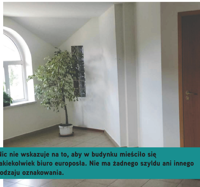
Nic nie wskazuje na to, aby w budynku mieściło się jakiegokolwiek biuro europośła. Nie ma żadnego szyldu ani innego rodzaju oznakowania.