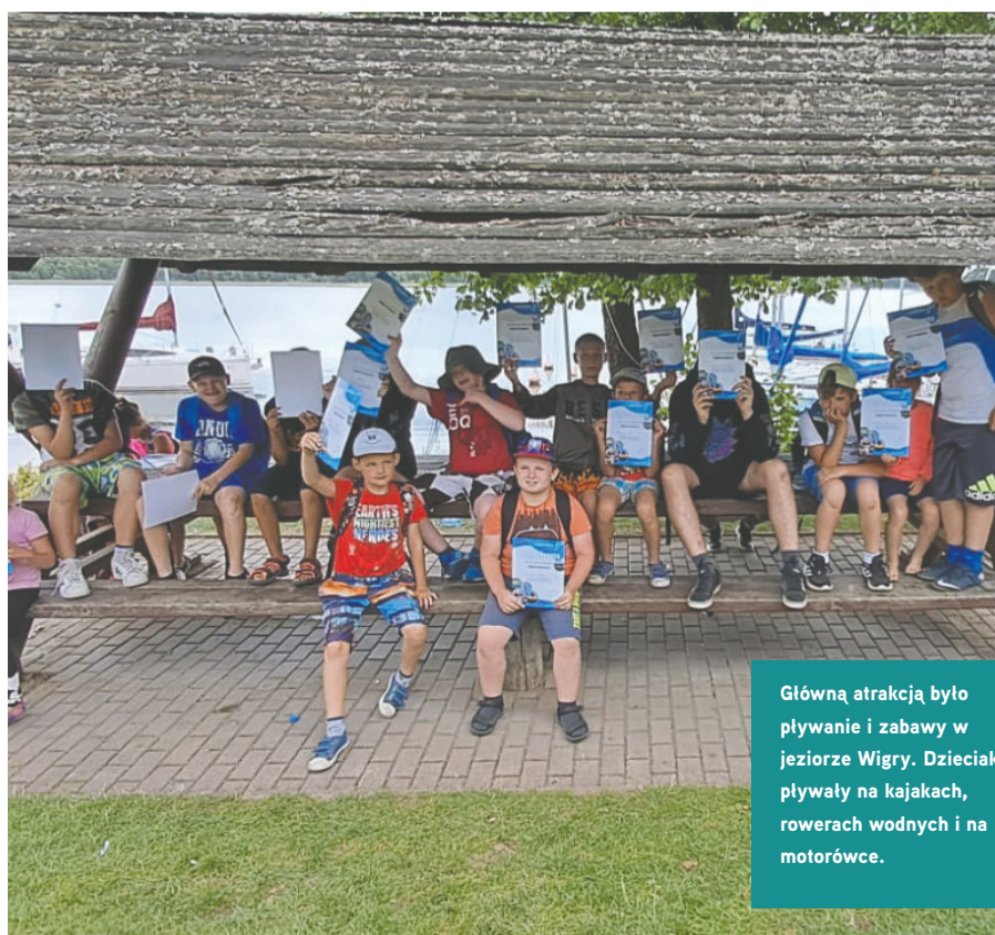
Główną atrakcją było pływanie i zabawy w jeziorze Wigry. Dzieciaki pływały na kajakach, rowerach wodnych i na motorówce.